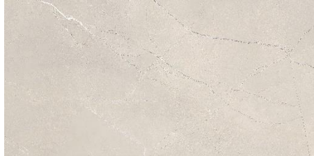
Керамическая плитка для стен Trend Pulpis Crema Rectificado 30x60